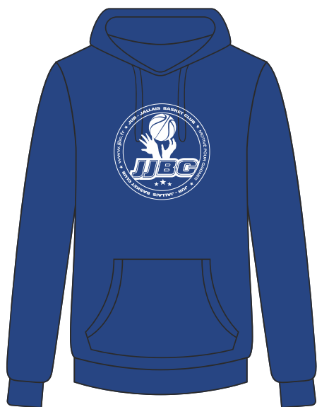
SWEAT CAPUCHE 80% Coton 20% Polyester