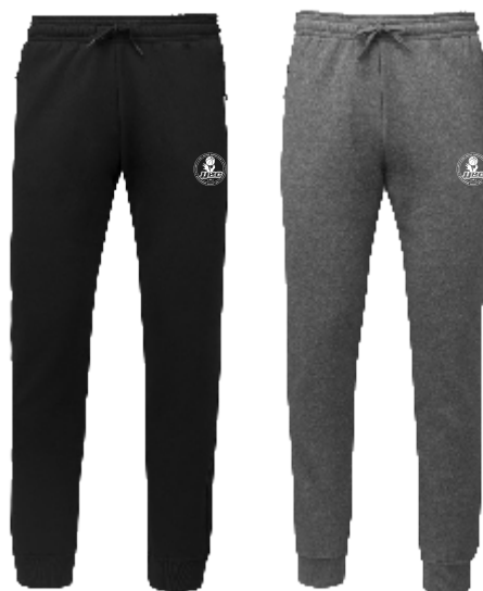
PANTALON FITTÉ 65% Polyester - 35% Coton. Bas resserrés.