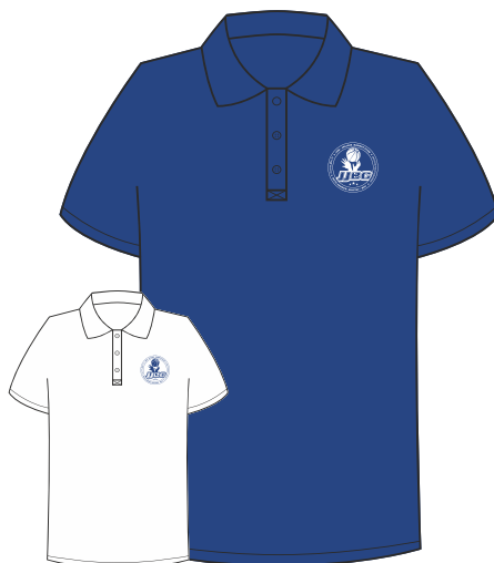
POLO 100% Coton piqué