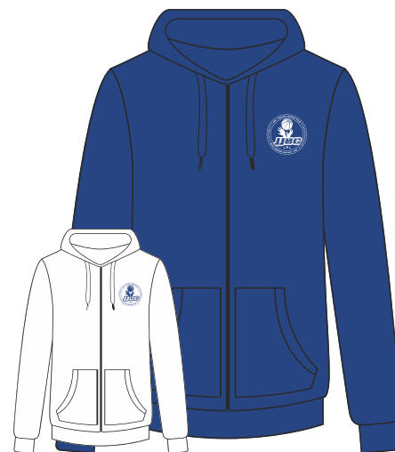
VESTE ZIPPÉE 80% Coton 20% Polyester