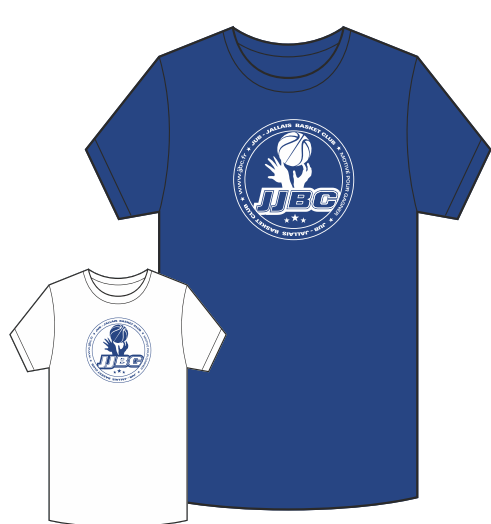
T-SHIRT 100% Coton